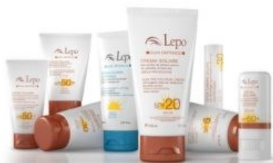
La linea di solari di ultima generazione di Lepo

Evitare le scottature, proteggendo la pelle. Il che significa, sul lungo, contrastare l'invecchiamento cellulare prevenendo la comparsa di rughe e macchie solari. Ma, nel breve termine, anche di garantire un'abbronzatura caraibica: intensa, uniforme e luminosa. Sì, scegliere la crema con il fattore di protezione più adatto al fototipo è davvero fondamentale. Ecco perché Lepo ha messo a punto un'intera linea dedicata. Gli ingredienti sono vegetali e provenienti da coltivazioni biologiche, quindi adatti anche alle pelli più sensibili e intolleranti, anche perché privi di siliconi e parabeni. Cosa aspettate a scegliere la formula che fa per voi?