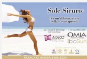
2015-04-08 Campagna Sole Sicuro, è prevenzione per i giovani