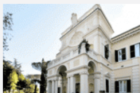
2015-04-08 Tre ministri per la Luiss, dopo Renzi ecco la Boschi