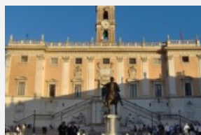
2015-04-08 Roma a rischio 'Def', il Campidoglio teme tagli