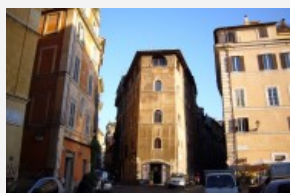
2015-04-08 Grossa voragine si apre vicino Piazza Navona