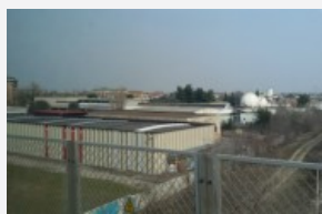
2015-04-08 Milano: Dante Ferretti contro Expo