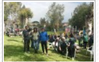
Ardea, via Crucis e scampagnate per Pasquetta