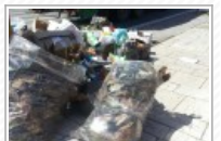
Anzio Colonia, la differenziata al mercato non pervenuta