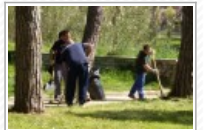
Nettuno- Domenica di pulizie al Palatucci, il bell'esempio arriva dai cittadini