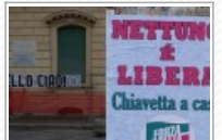
Nettuno- Chiavetta a casa, messaggi, sfotto e... qualche svista