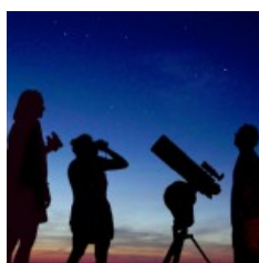
Il 9 agosto a Torre Astura