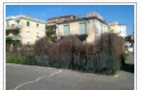
Anzio- Il rudere di via del Faro abbandonato da anni