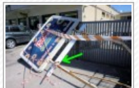
Pericolo ad Anzio Colonia, il cartello giace a terra da due mesi