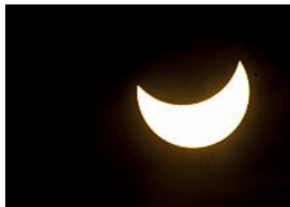
L'eclissi di sole dà il benvenuto alla primavera...