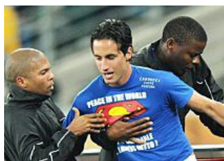
Il "Falco" vola in tribunale con la pistola