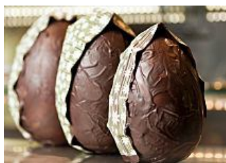
Pasqua: il cioccolato fa bene alla salute