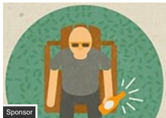
8 parole che non si possono tradurre in italiano (Babbel)