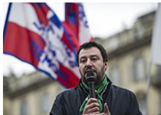
Immigrazione, Salvini: "Occuparemo gli alberghi..."