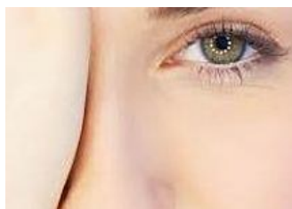
Liberi dagli occhiali dopo una certa età